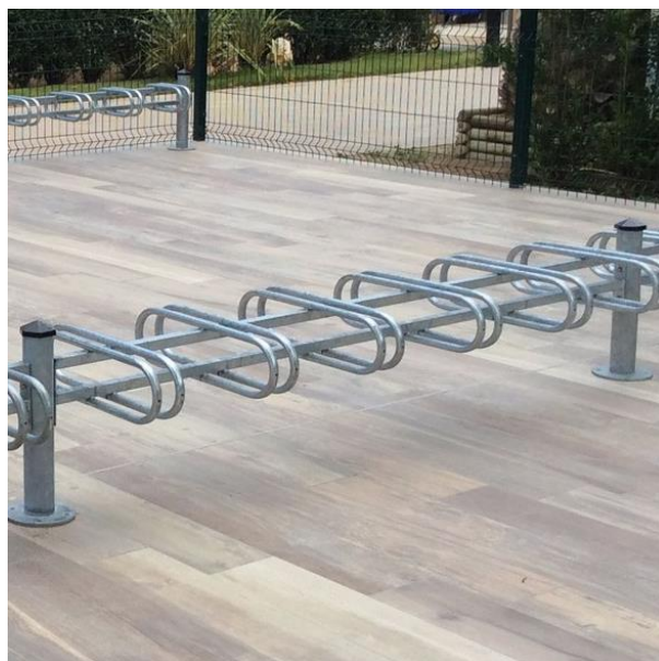
Version 6 places double face avec extensions