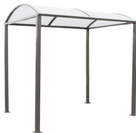
Abri initial sans bardage - Réf. 529 040