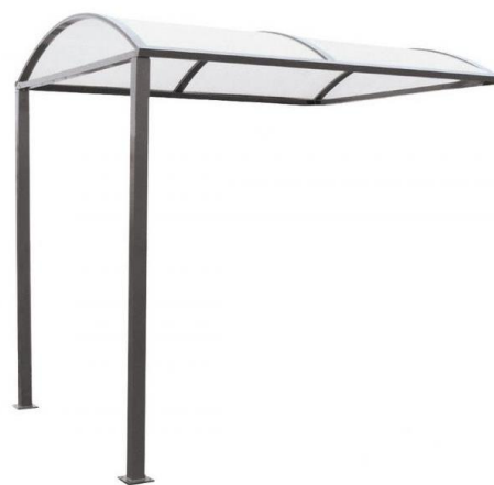
Extension sans bardage - Réf. 529 041

Éclairage LED (pour version éclairage LED intégré) : ruban de LED intégré à la structure et monté en usine. Alimentation sur réseau électrique 220V, branchement à réaliser par un professionnel (disjoncteur non fourni)