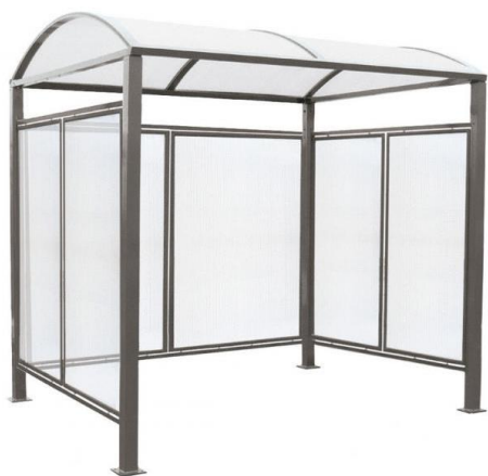
Tout-en-un : abri initial + bardages latéraux + bardage de fond - Réf. 529 050