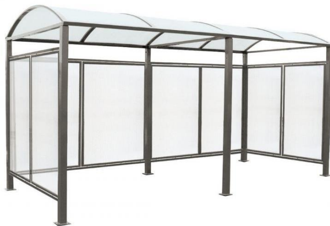
Tout-en-un : abri initial + 1 extension + bardages latéraux + bardage de fond - Réf. 529 374