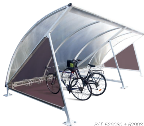
Réf. 529030 + 529031