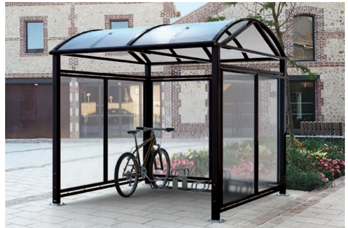
Réf. 529082 + 204719